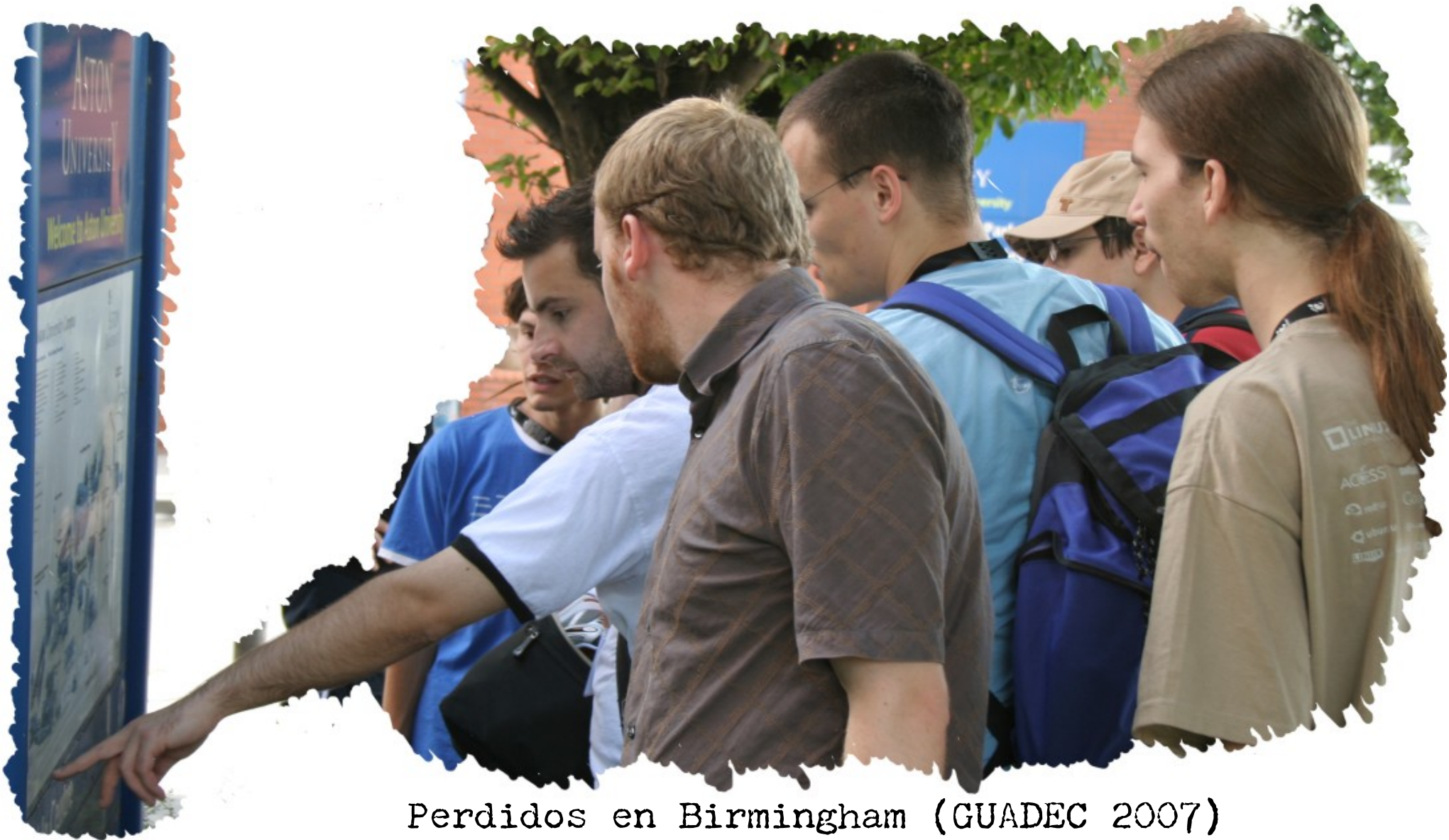
Perdidos en Birmingham (GUADEC 2007)